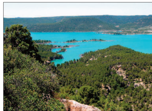
En el embalse de Contreras podemos hacer senderismo.