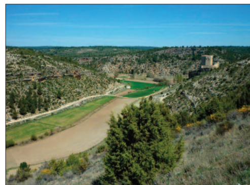
Sendero en Paracuellos.